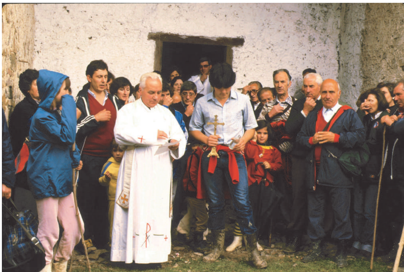
Imagen de la romería en el mes de mayo.