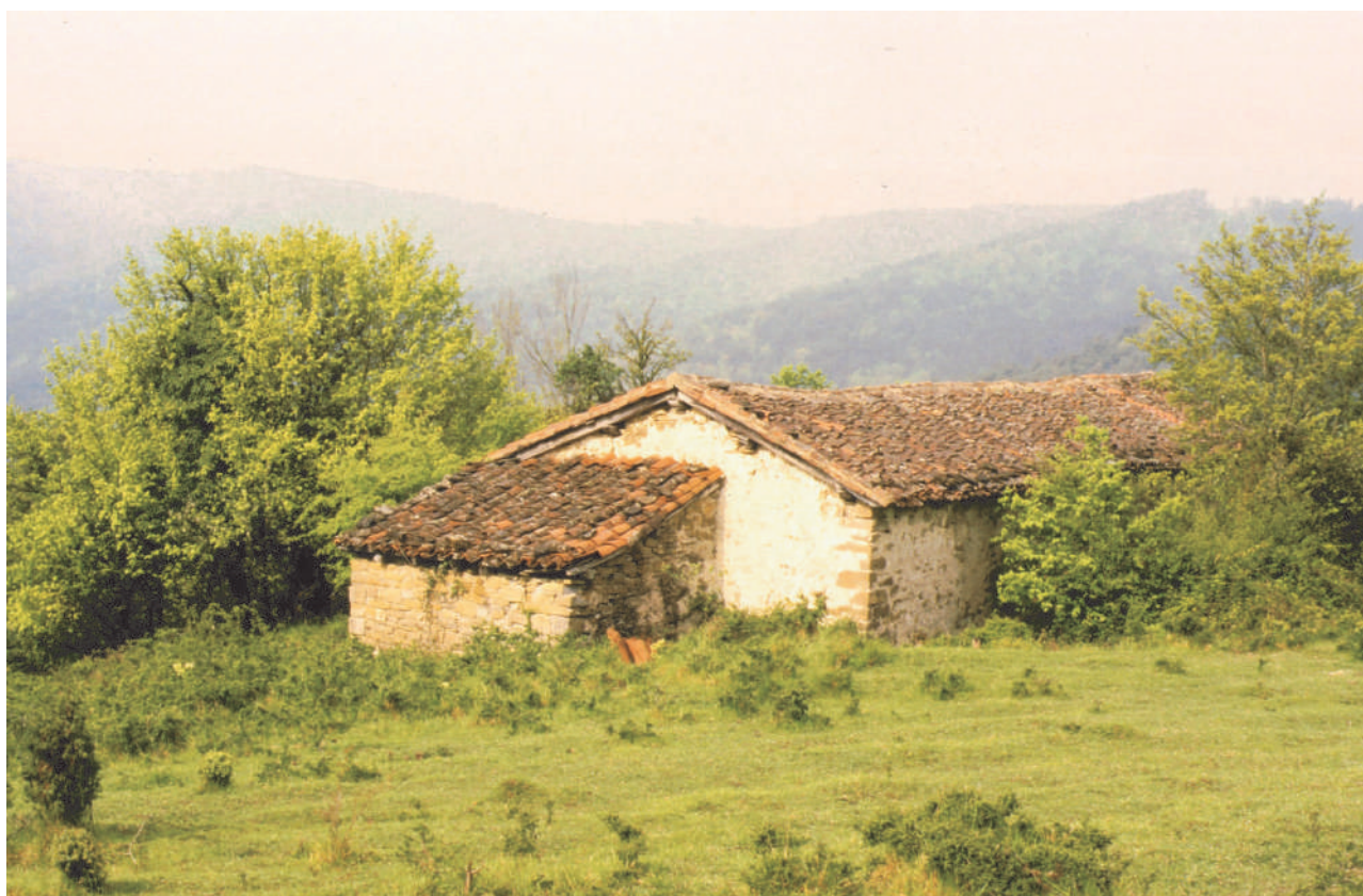
La ermita de Basagaitz desde el exterior.