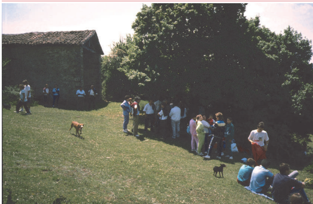
Almuerzo en las campos de la ermita tras la romería

jado al retrasar la puerta de acceso respecto del límite de los muros. El estado de conservación actual es precario, necesitando una buena reforma y rehabilitación.