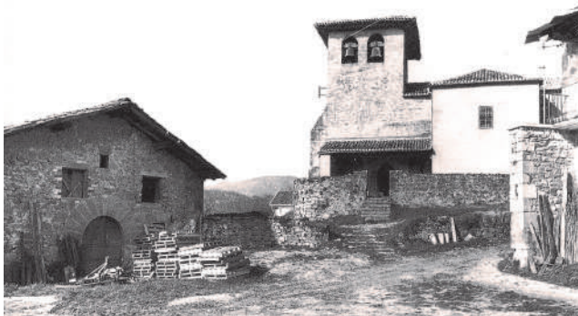
Yaben, Basaburúa Mayor (Navarra).