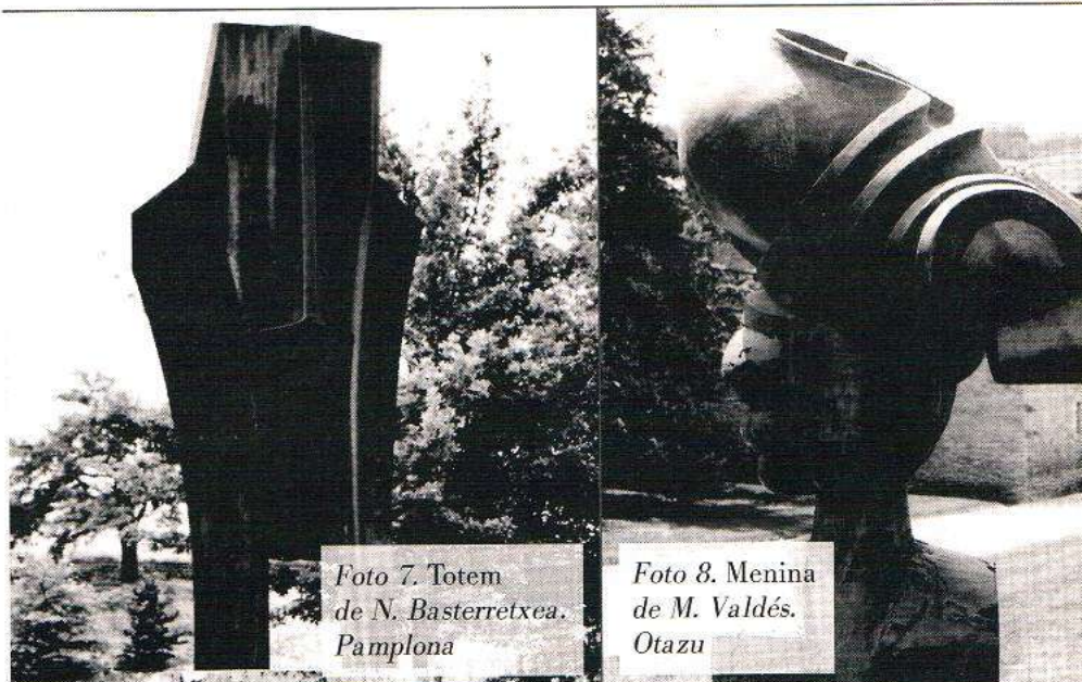
Foto 7. Totem de N. Basterretxea. Pamplona

Aparte de escultores navarros queremos destacar a varios escultores vascos . Ellos se encabezan por el genio de Jorge Oteiza, que cuenta con 15 obras. En Pamplona destacan «Coreano» en la Plaza Conde Rodezno y «Unidad Triple Liviana»