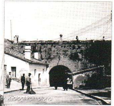
Arriba: El portal Nuevo a principios del siglo xx.