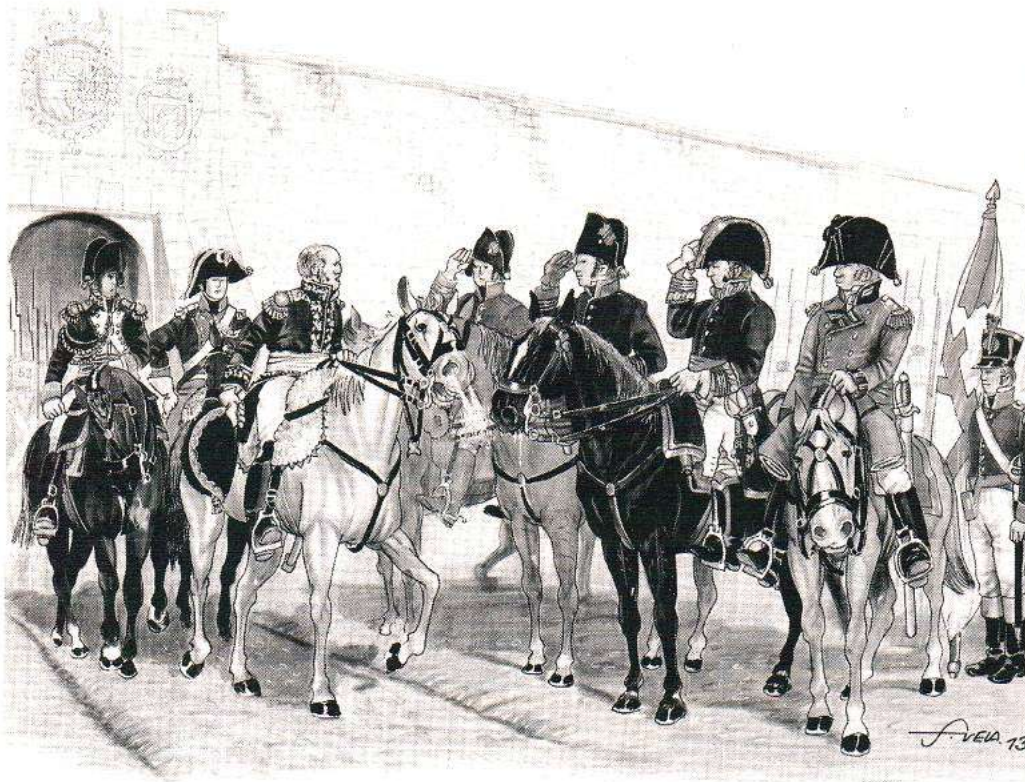
Recreación de la salida de Pamplona de las tropas francesas el 1 de noviembre de 1813. Dibujo de Vela