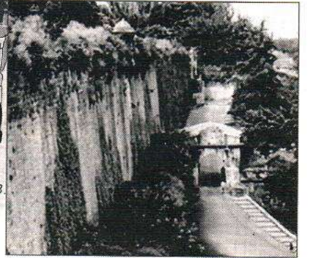
Abajo: El portal de Francia

Al día siguiente, 1 noviembre, festividad de Todos los Santos, a partir de las dos de la tarde, se llevó a cabo la salida de las tropas francesas por el Portal Nuevo. Una vez finalizada la operación, hizo su entrada triunfal en la ciudad, entre las aclamaciones de los pamploneses, el general don Carlos de España al frente de su estado mayor. Por expreso deseo suyo y «para rendir al Todopoderoso las debidas gracias por un beneficio tan grande y tan singular», se cantó un solemne Tedeum en la Catedral, al que asistió, junto con el ayuntamiento, el liberador al mando de sus tropas. Inmediatamente después, hubo repique general de campanas en todas las iglesias y conventos.