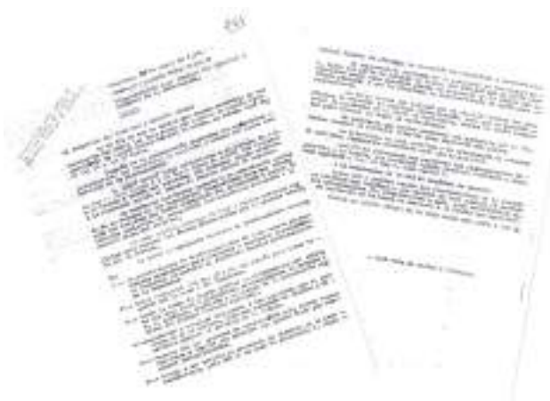
El informe que Ruiz de Gordo envía al ministro de Gobernación, Manuel Fraga, sobre la reunión que ha mantenido con Pepe Arturo y Sixto en el hotel Tres Reyes.

de Estella. Ese plan consistía, fundamentalmente, en actuar sobre la concentración desde tres puntos distintos: la cumbre, que se debería ocupar unos días antes; la plaza del Monasterio de Iruche, para neutralizar la propaganda de los “huguistas”, como se denomina a los seguidores de Carlos Hugo, y desde las campas situadas tras el cenobio para controlar el Via Crucis que desde aquí asciende hacia la cima del monte.