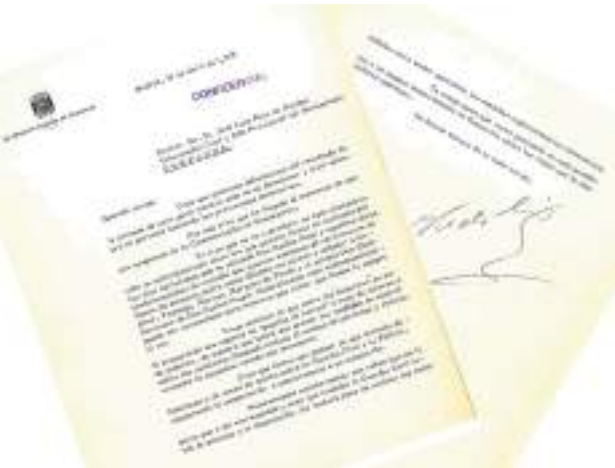
Carta del director general de Seguridad apremiando al gobernador civil de Navarra a preparar una estrategia ante la convocatoria de Montejurra 76.

Otros documentos que evidencian no sólo la implicación del Gobierno en la Operación Reconquista sino en su diseño son el plan "Montejurra Tradicionalista" y la "Orden extraordinaria" para las fuerzas policiales, que, según informará posteriormente el gobernador civil al fiscal de la Audiencia de Pamplona, fue "aprobada por la superioridad". Ambos documentos se refieren explícitamente a la participación de gobernadores civiles y alcaldes, que deben fletar y organizar un centenar de autobuses en una veintena de provincias para trasladar a 5.650 personas, a las que se equipará con brazaletes distintivos -6.000-, boinas rojas -2.000- y "garrotas de campo" -otras 2.000-, más una dieta personal de 750 pesetas.