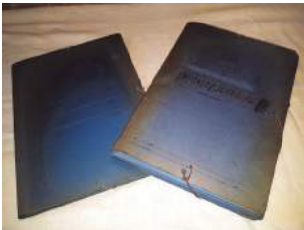
Las dos carpetas donde se conservaban los documentos ahora revelados y que están en posesión del Partido Carlista.

La aparición de unos documentos oficiales que contradicen la versión admitida hasta ahora sobre los graves sucesos ocurridos en Montejurra el año 1976 tienen especial trascendencia para Navarra, ya que afectaron de lleno al carlismo, principal movimiento político en la historia contemporánea del Antiguo Reyno, cuando, tras la muerte de Franco, se iniciaba un periodo clave para la transición de la dictadura a la democracia.