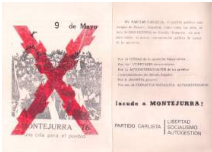
Panfleto –anverso y reverso– con la convocatoria a “la mayor concentración política de masas de la oposición” el 9 de mayo de 1976.

Otro de los datos reveladores del plan civil estaba en el reconocimiento implícito del escaso apoyo que la convocatoria iba a tener entre los sectores más tradicionalistas del carlismo. En el apartado 4 (Cálculo de asistentes) se informa de que la Hermandad del Maestrazgo, una de las organizaciones inicialmente convocantes, todavía no había dado una respuesta positiva y que la Hermandad de Excombatientes podía “aportar pocos efectivos”. Los atestados de la Guardia Civil no hacen más que confirmar tal extremo al calcular que, frente a los miles de seguidores del Partido Carlista, la UNE apenas había logrado reclutar seiscientas personas.