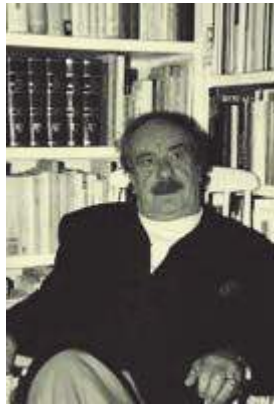
Mario Angel Marrodán. "Los pinceles de Vasconia" La Gran Enciclopedia Vasca., Bilbao, 1974.

Kontenplatiboa kliskatu zuen bere kontzertuari tonua emanaz Gure arima sentikor bihurtu zuen garai guztietako sustraía.