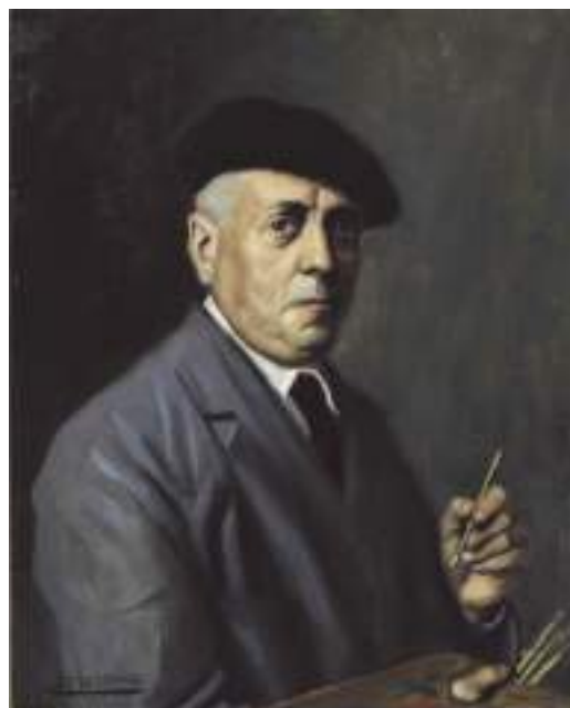
Javier Ciga, Autorretrato (1951).

Giza irudikapenatik haratago, bere barneko mundo aberatsaren ikonografia Figurazio esentziala, egiazat ulertuta Javier Ciga gauza guztien gainetik, bere garaiko arimaren eta gizartearen interpretea izan zen.