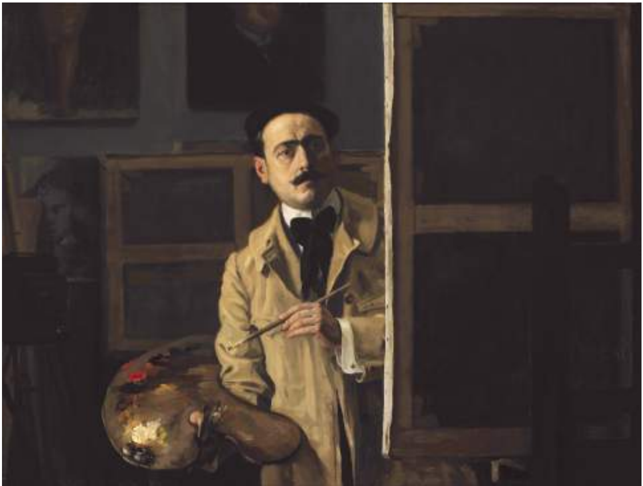
Javier Ciga, autorretrato (1912). Fundación Javier Ciga.

Parpadeó contemplativo entonándonos su concierto. Sensibilizó nuestra alma, raíz de todos los tiempos.