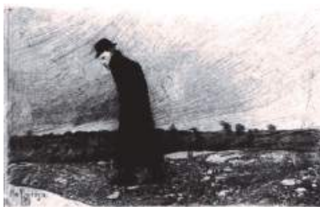
Pío Baroja, aguafuerte de su hermano Ricardo Baroja.

Después de haber leído y releído a lo largo de los años a don Pío Baroja, a sus hermanos Ricardo y Carmen y a sus sobrinos Julio y Pío Caro Baroja, ya conozco todo lo que nos va contando nuestro anfitrión de hoy: las columnas de piedra del zaguán que sujetan la gran viga de madera de roble de más de catorce metros; los reposteros con los blasones heráldicos de los Alzate, los Baroja y los Go-