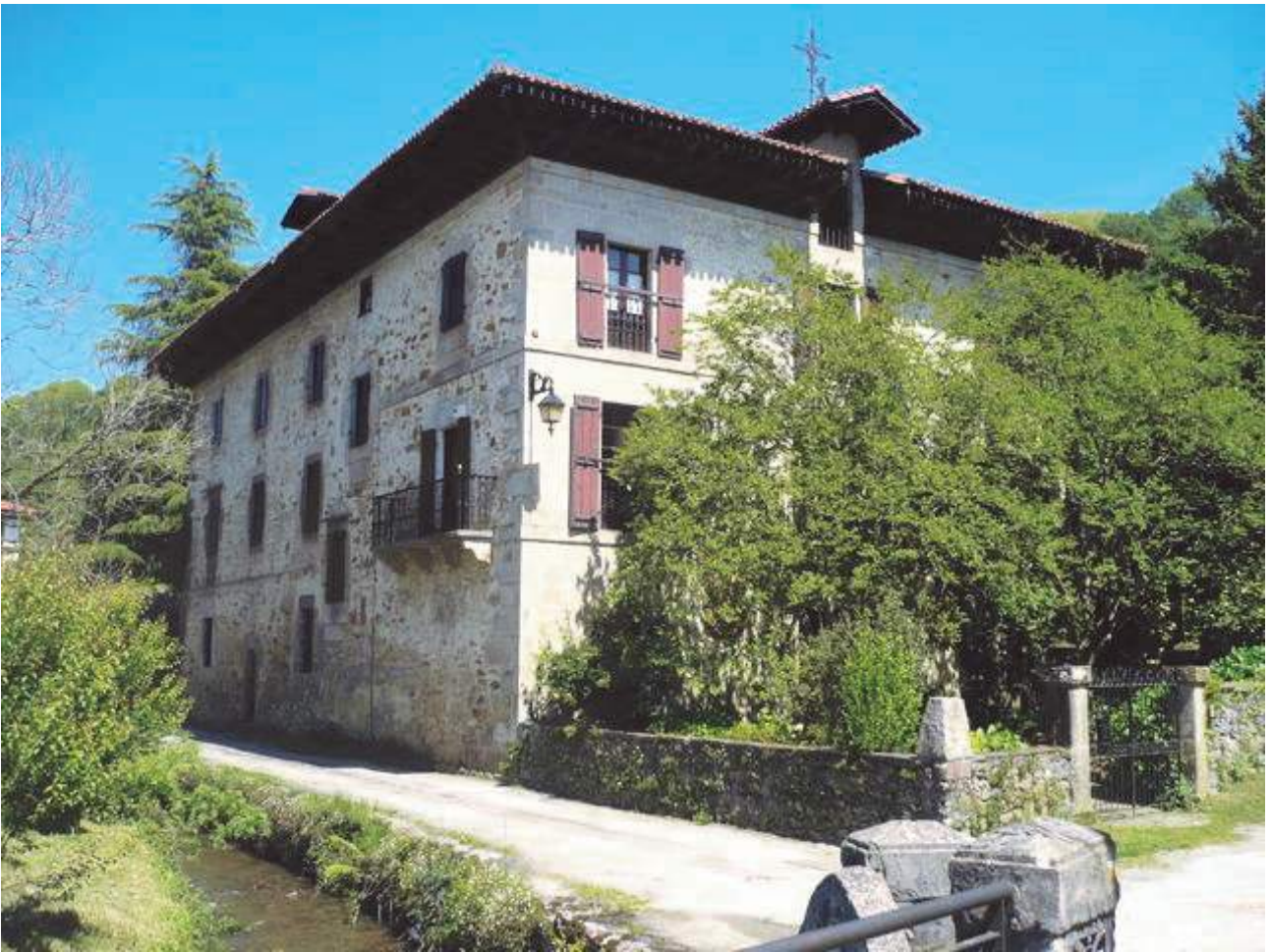
Vista de la Casa Itzea, en Vera de Bidasoa.