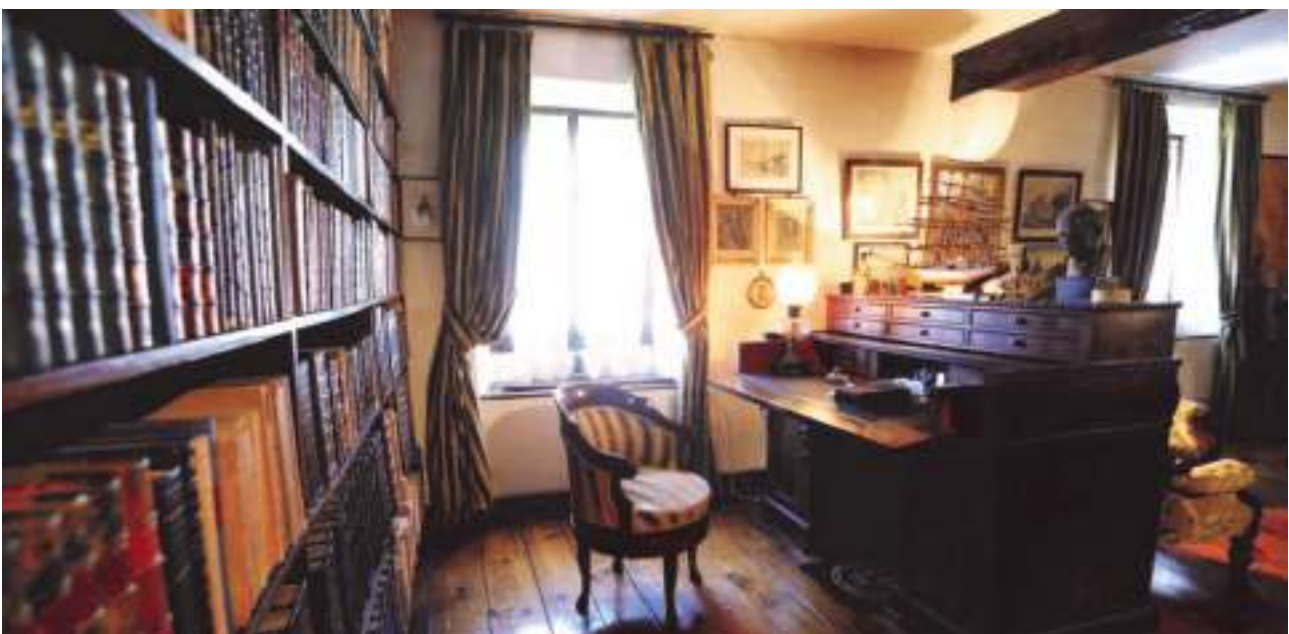
Interior de Itzea