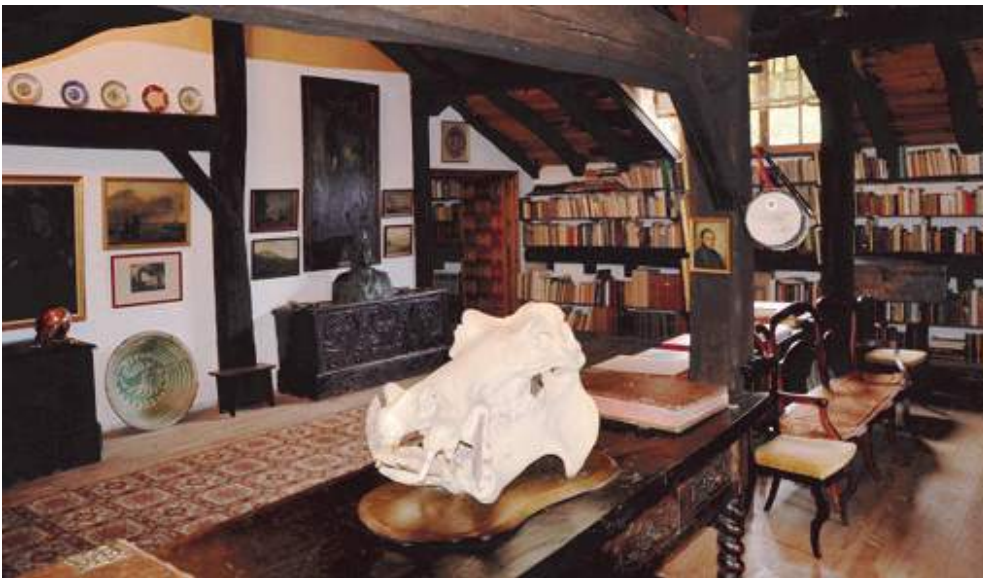
Desván de Itzea.