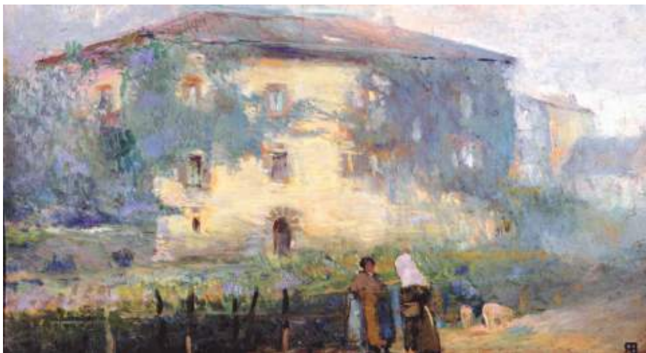
Itzea de Vera, óleo de Ricardo Baroja.

No puede haber despedida más barojiana. Desde el camino, volvemos la cabeza, incrédulos de haber contemplado y convivido con un mundo maravilloso de literatura y de nostalgia. PRE GON