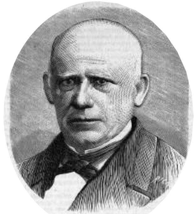
Pascual Madoz. Grabado. La Ilustración de Madrid (1870).

Esta transformación del año 1991 se debió al aumento de población y a la industrialización de los concejos de Berriozar y Ansoain que se constituyeron en ayuntamientos independientes pasando Berrioplano a ser sede y capital del municipio compuesto por Añéscar, Aizoáin, Artica, Ballaráin, Berriosuso, Elcarte, Larragueta, Loza y Oteiza . Esta nueva cendea prosigue el legado de la anterior; aunque no tenga efectos económicos productivos, permanece en el recuerdo, y en el acervo cultural de nuestro singular solar navarro.