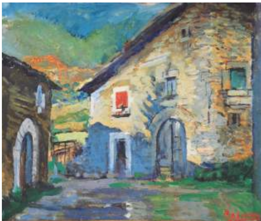
J. Basiano. Aizoáin. Óleo en cartón/lienzo. 47x56 cm. 1963.

«Localidad con ayuntamiento de la cendea de Ansoáin, en la provincia, audiencia territorial y capitania general de Navarra, merindad, partido judicial y diócesis de Pamplona (1/2 legua). SITUADA. a la margen derecha del río Arga en la falda del monte Escaba, donde le batien todos los vientos; disfruta de CLIMA saludable. Forman la población 18 CASAS, y una igl. parr. dedicada á S. Estéban, servida por un cura. Distante 150 pasos del pueblo se halla el barrio de Oronsospe, que tiene 4 casas, y es propie-