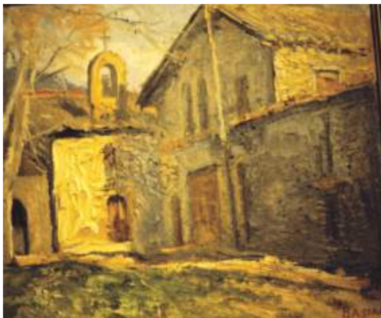
Jesús Basiano. Aizoáin. Óleo/tabla. 33 x 41 cm. 1960.

halla dotado con 1,152 rs. anuales. Confina el TÉRM. por N. con el del mencionado Oteiza (1/4 de leg.), por E. con el de Berrioplano (1/2; por S. con el de Larragueta (1/4), y por O. con el de Sarasa (1/2); El TERRENO es montuoso y lleno de aspereza especialmente por la parte del O.; en diversos puntos del mismo nacen fuentes de buenas aguas que utilizan los hab. para sus necesidades domésticas y otros objetos de agricultura: PROD. trigo, cebada, legumbres y buenos pastos, con los que se alimenta porción de ganado lanar, cabrío, y vacuno: POBLACIÓN. 10 vecinos, 107 almas. CONTRIBUYE con su cendea y ayuntamiento.