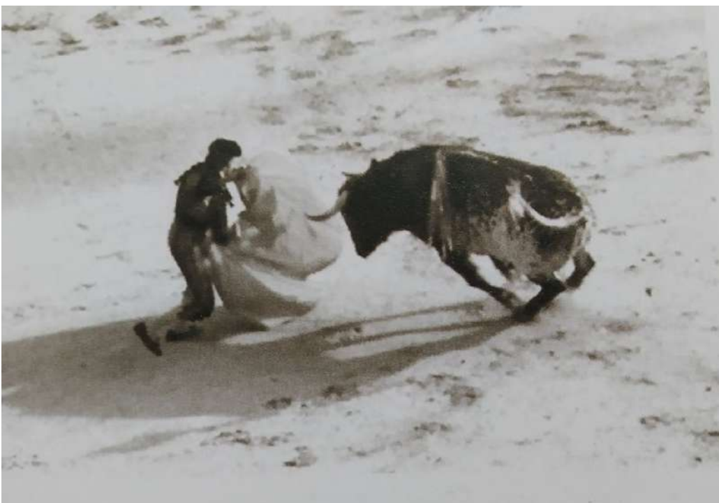
Toros en Tudela el año 1898.