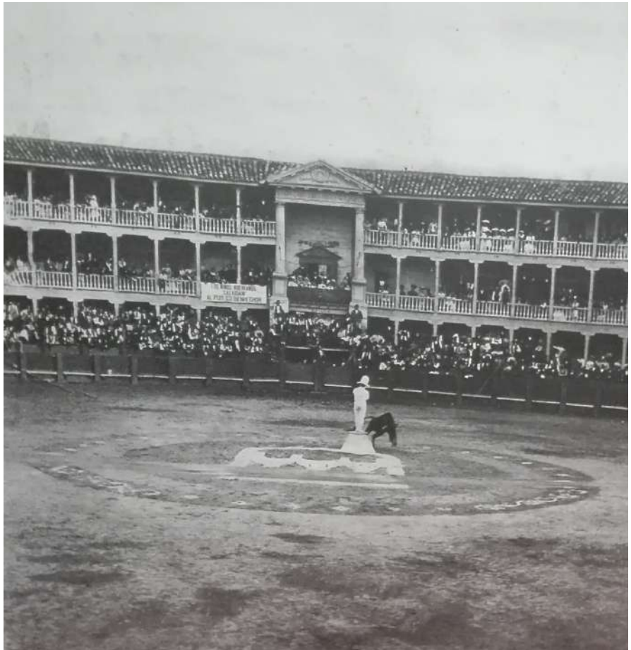
Espectáculo taurino en la vieja plaza del pase de Invierno de Tudela.

La celebración de espectáculos taurinos en tardes de fiestas predisponía, como ha sido