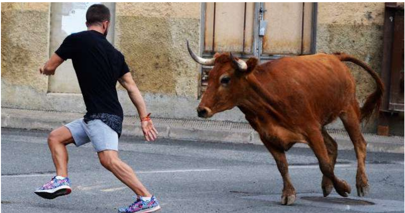
La casta navarra en la calle.