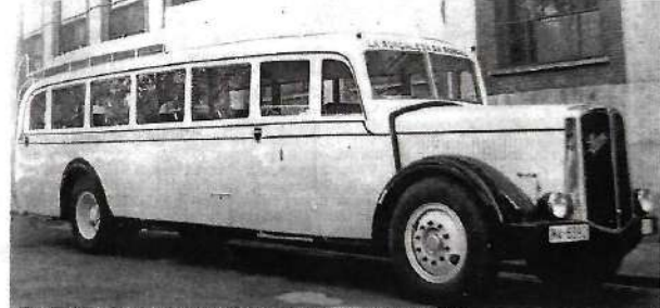
Un Saureur de La Roncalesa NA 6392 hacia 1950 (Gran Enciclopedia Navarra).