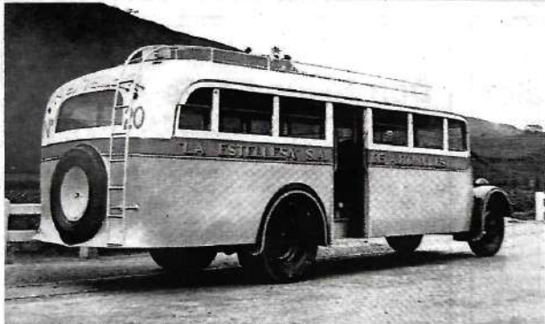
Autobús de La Estellesa en los años 40.