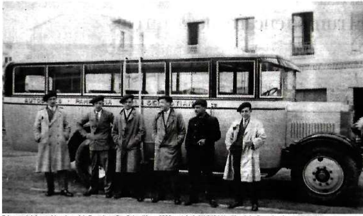
Primer autobús que hizo el servicio Pamplona-San Sebastián en 1928, matrícula NA 1494.