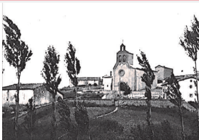
Erice de Iza por Julio Altadill a principios del siglo XX

La iglesia parroquial (San Pedro) es curato de entrada y se halla servida por un abad, de provisión del dueño de Echeverri, y es matriz de Isurieta cuya basílica y palacio, así como la venta de Gulina están en su TERMINO, donde tampoco faltan fuentes para el surtido de sus habitantes. Confina al Norte con Cía; Este Larunbe; Sur Sarasate; y