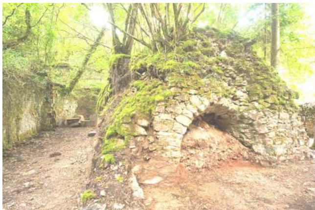
Proyecto turístico Yelmo. Real fábrica de armas de Eugui.

El Archivo Real y General de Navarra acogió desde el 10 de octubre de 2018 hasta el 13 de enero de 2019 la exposición "Baja Navarra, un territorio singular / Baxenabarre, lurralde berezia / Basse Navarre, un territoire singulier".