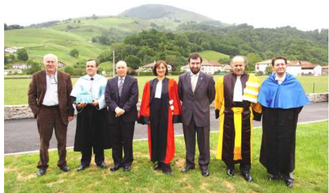
Colegio Juan Huarte de San Juan.

Por otro lado, Les Amis de la Vieille Navarre establecieron con los Amigos del Camino de