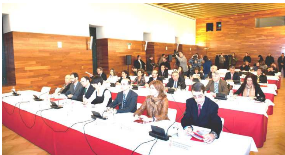
Comisión 2012. Asistentes a la comisión en el Archivo Real y General de Navarra.

En enero de 2020 nació la Asociación Dos Navarras , una entidad cultural con ámbito de actuación y asociados a ambos lados de los Pirineos. Sus fines se basan en la promoción, el apoyo y el impulso de actividades culturales tendentes al fomento y defensa del patrimonio y significado de las dos Navarras, así como nexo de colaboración en otras materias que contribuyan a crear oportunidades de todo tipo en ambos territorios, como el desarrollo comercial, turístico, educativo, cultural, etc. La Asociación Dos Navarras considera de gran interés para la Baja y para la Alta Navarra, para el conjunto de sus ciudadanos y para sus instituciones, el intercambio de conocimientos y de experiencias y la participación mancomunada y recíproca en proyectos comunes. Esa finalidad ha sido uno de los motores de la creación esta asociación.