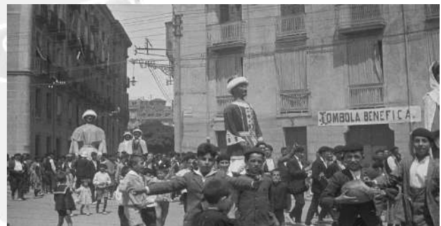
Fiestas de San Fermín en Pamplona. Los gigantes de Pamplona en las calles Espoz y Mina y Duque de Ahumada. 1930.

Afirman estos mismos cronistas que este obispo marchó a la sede de Valencia poco después para continuar una labor impregnada de profundo amor divino. Se debió inspirar en iniciativas similares que se desarrollaban en la ciudad del Turia. No es uno quién para dudar sobre ello. Pero... ¿seguro que no hubo un «antes» de este «después»?