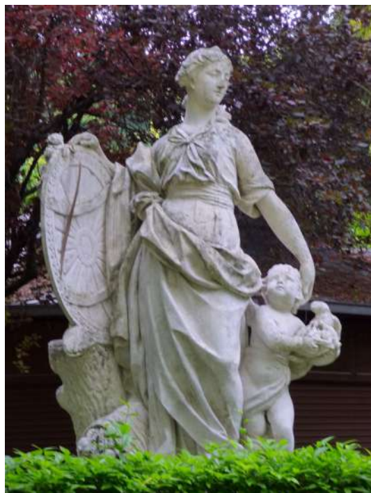
Beneficencia (Mariblanca) - Jardines de la Taconera.