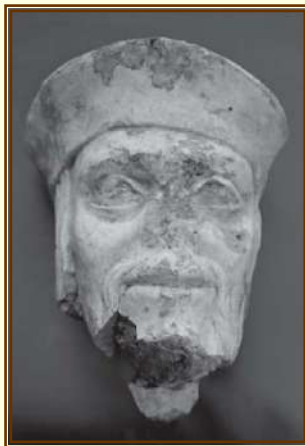
Estado de la cabeza de César Borgia tras la desaparición