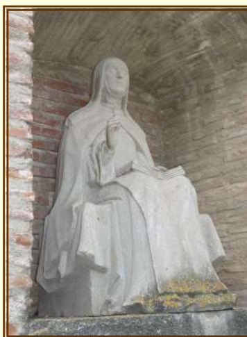
Imagen Sta. Teresa, en Convento de Ávila.

Esta obra esta recogida en la Guía de la escultura urbana de Pamplona (2010) , en artículo escrito por Don José Javier Azanza, profesor de Historia del Arte en la Universidad de Navarra.