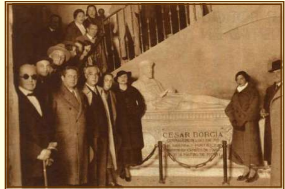
Inauguración del monumento a Borgia.