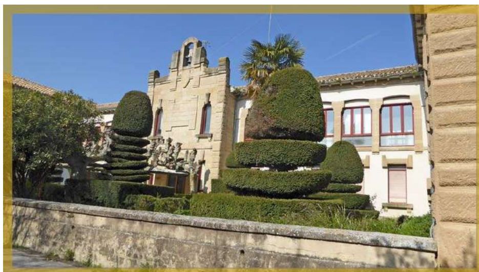
Fachada del Antigo Hospital

Vamos a continuación con las quintillas del Cuto Divino.