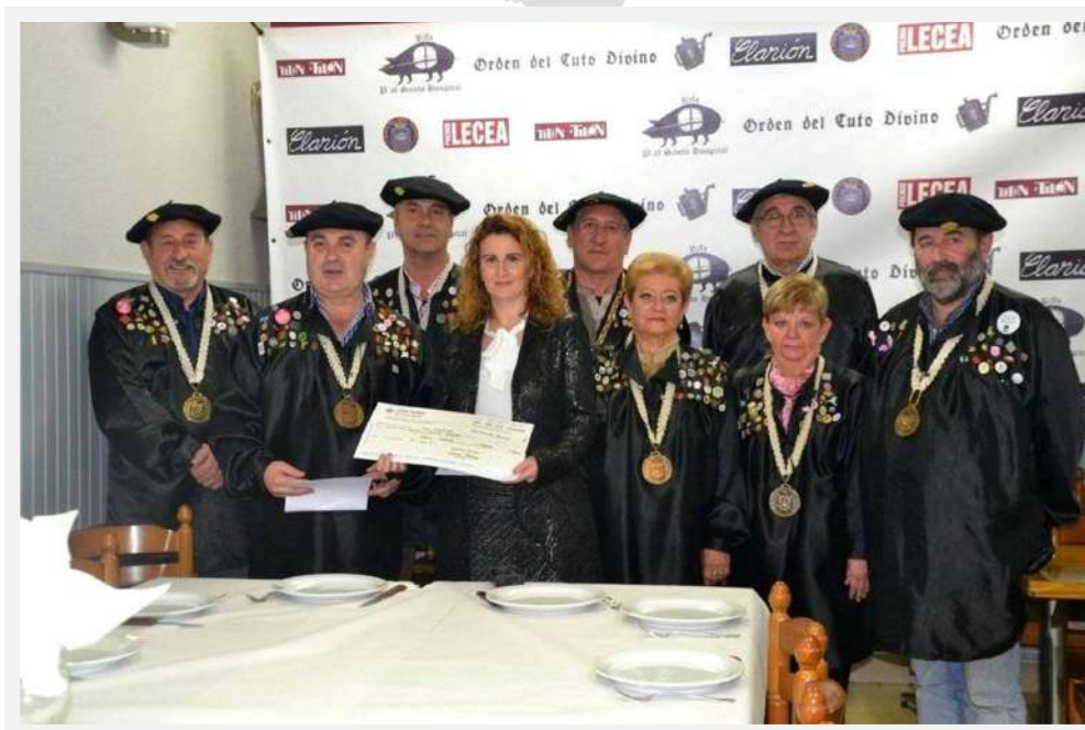
Miembros del Cuto Divino el año 2019.