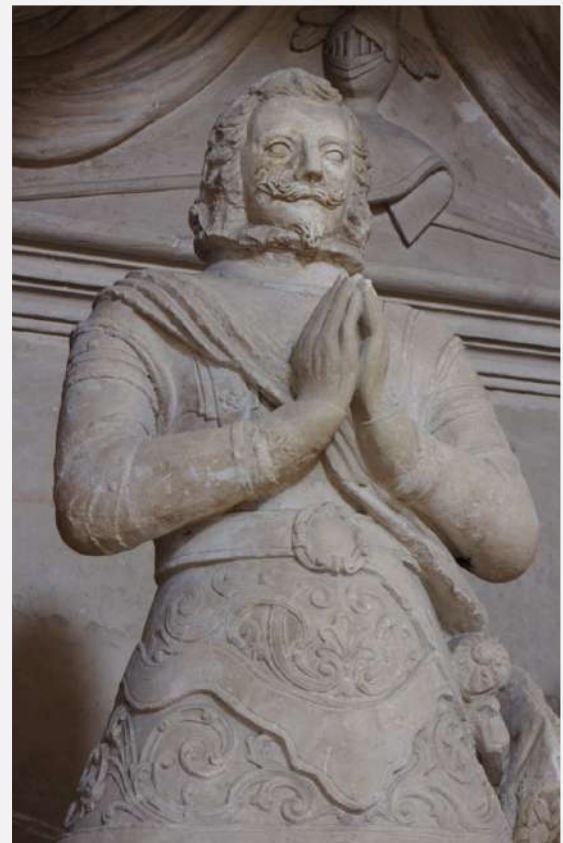
Estatua de Martín Carlos de Mencos y Arbizu en su enterramiento (convento de las Concepcionistas Recoletas de Tafalla).

Un apartado interesante del libro de biografías y hasta ahora inédito, ha sido la abundante documentación encontrada en Centro América, en lo que antiguamente era la Capitanía General de Guatemala, donde hemos encontrado hasta doce Mencos militares que defendieron los intereses de España, habiendo sido Martín Carlos de Mencos Capitán General de Guatemala, su hermano Gabriel, Capitán General en Santa Marta y Riohacha y Melchor de Mencos General de las tropas de Guatemala quien además se instaló allá y dejó una notable descendencia de militares, por cuanto, que en cuatro generaciones posteriores aún se encontraban ligados a las armas.