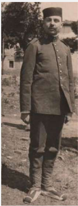
Tiburcio Mencos y Bernardo de Quirós, marqués de la Real Defensa, con el uniforme del Regimiento América 14 (1915).

Otro aspecto significativo es que han participado en la práctica totalidad de los conflictos durante cinco siglos. Hemos encontrado referencias de Mencos a primeros del siglo XV, en las guerras de los Castellanos, Aragoneses y Navarros y en el siglo XX en el transcurso de la segunda guerra mundial. Hay conflictos donde coinciden parientes Mencos de varias generaciones, son cinco los que participan en 1793 en la guerra contra Francia, cuatro en 1808 en la de la independencia, cuatro en 1936 en la civil Española, y otros cuatro en las guerras carlistas, con la paradoja que dos lo hicieron en el bando Isabelino y los otros dos en el Carlista.