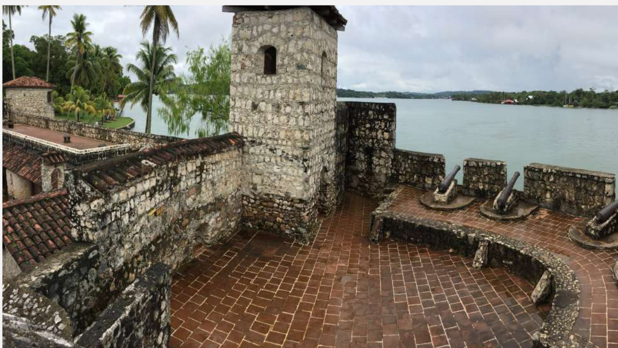
Castillo de San Felipe de Lara, Río Dulce (Guatemala).