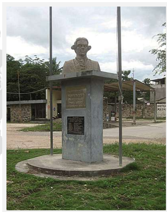
Busto de Melchor de Mencos y Barón de Berrieza en la ciudad de su nombre (Guatemala).

Pero además del elevado número de personajes Mencos militares encontrados, nueve de ellos alcanzaron el Generalato y doce de ellos alcanzaron el empleo de coronel. En la publicación se mencionan casi una centena de personajes, de los cuales se han desarrollado cuarenta y cuatro biografías, por ser los personajes más relevantes y disponer de más documentación sobre ello. Todas las biografías están enlazadas genealógicamente para que se pueda ubicar al personaje en el árbol familiar.