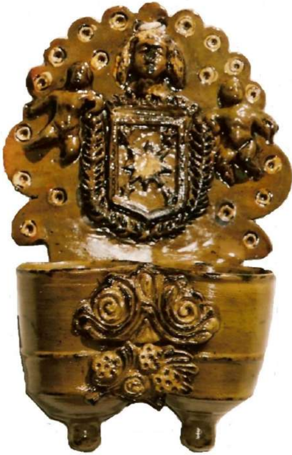
Cucharero de alfarería estellesa Alfar de los Ybirucu. Medias: 34 x 24 cm. Principios siglo XX. Colección particular (Pamplona).