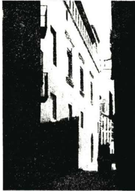
Tafalla.—Palacio que fué del Arzobispo don Francisco de Navarra en la calle de San Juan, (Foto Clavería)

¿Dónde vivieron, en Tafalla, la viuda e hijos del Capitán Juan? El Padre Cros, que es quien primero investigó el archivo Notarial de Tafalla a principios de siglo, exhumó algunos documentos en su edición de 1903 (Saint Francois de Xavier: Son pays, sa famille, sa vie...). No puede concretar, exactamente, el lugar. Desde luego era en la Parroquia de San Pedro, cerca de las casas de Munárriz y Vergara. La tradición, viene señalando como la casa donde San Francisco Xavier vivió alguna temporada, una que hay en la misma calle de San Juan, frente al citado Palacio, en la aludi-