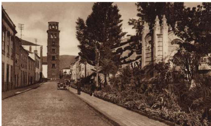
Calle de la carrera en 1927. La Laguna de Tenerife.

Me temo que lo de Lagunera es toda una incógnita. Hace muchos años se lo pre-