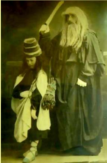
Alegoría del Antiguo Testamento en la procesión: Abraham e Isaac.