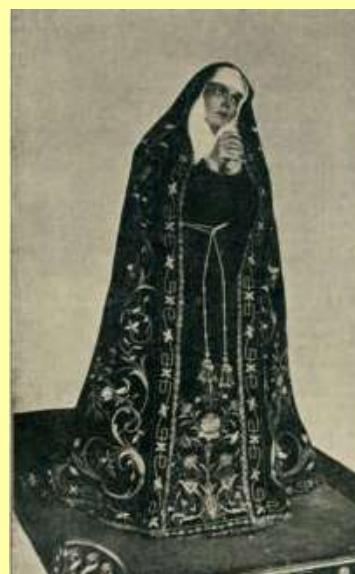
Nuestra Señora de la Soledad, la Dolorosa. Fotografía de Roldán y Mena publicada en La Avalancha n° 74 (1898).