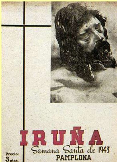
Revista Iruña, Semana santa de 1943.