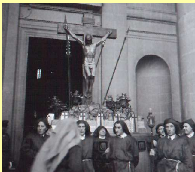
Los hermanos portadores del Cristo Alzado esperan la orden de salida de la Catedral. Fotografía de Nicolás Ardanaz, años 50.

El corderico blanco que va en la procesión, lo comen los mozorros después en chilindrón.