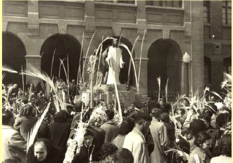
Procesión del Domingo de Ramos en 1955.

Abraham lleva en la cara unas barbas de crin, e Isaac un gorro raro que parece un budín.