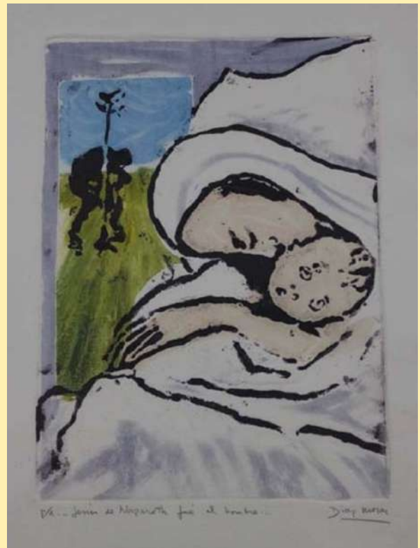
Virgen con niño.